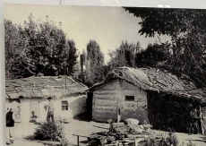
Вид на деревню в долине реки Ханган, 1908 г.