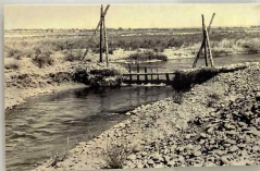
Мост через реку Ханган, 1908 г.